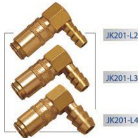
▲ 功能：模具冷卻 FUNCTION : MOLD COOLING