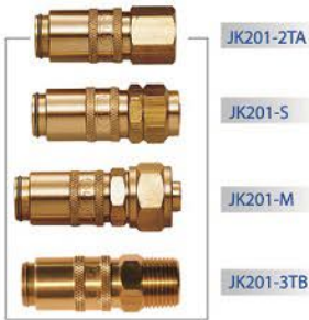
▲ 功能：模具冷卻 FUNCTION : MOLD COOLING