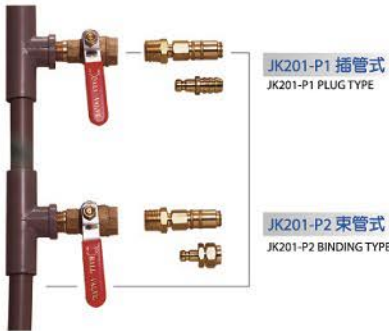
▲ 功能：模具源頭供水 FUNCTION : MOLD SOURCE WATER SUPPLY