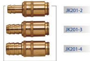
▲ 功能：模具冷卻 FUNCTION : MOLD COOLING