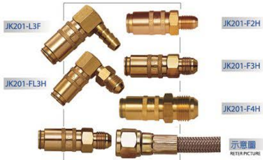
▲ 功能：耐高溫、油、蒸汽，保證耐溫180°C 安全耐用 FUNCTION : HIGH TEMPERATURE, OIL, STEAM RESISTANCE, GUARANTEE SAFETY AND DURABLE 180°C